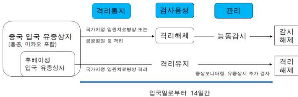
<그림 1. 의사환자 1 격리해제 및 감시 방안>