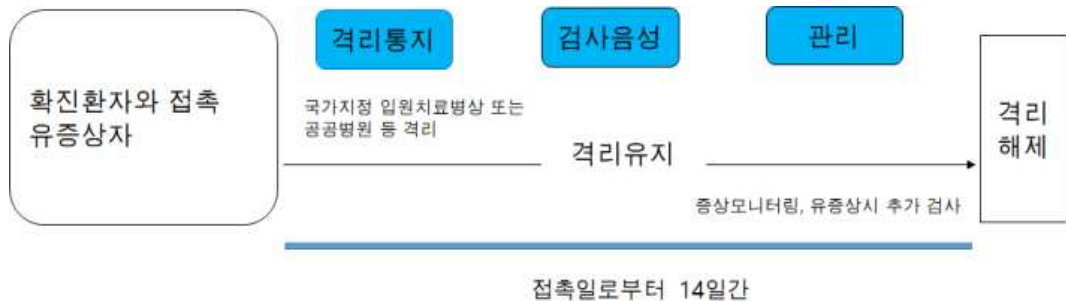
<그림 2. 의사환자 2 격리해제 및 감시 방안>